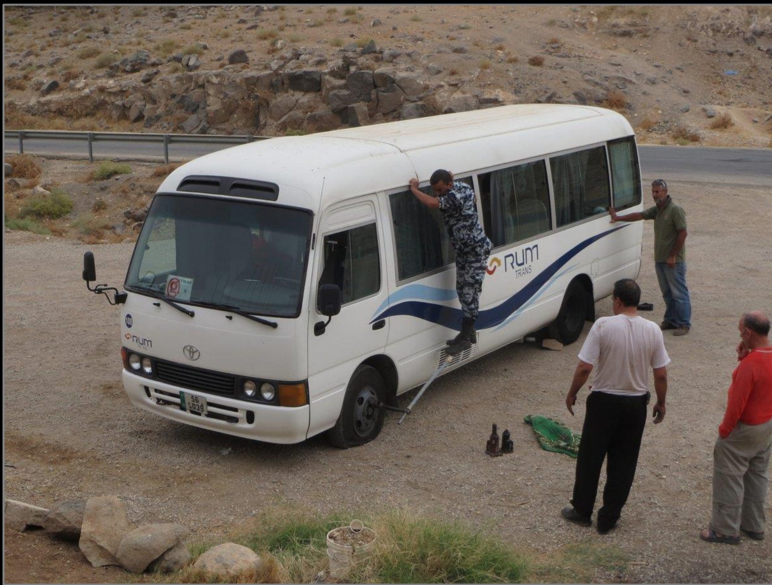
יום 4 – דיאבת ואום חשיבה מתחילים ברגל שמאל עם תקר