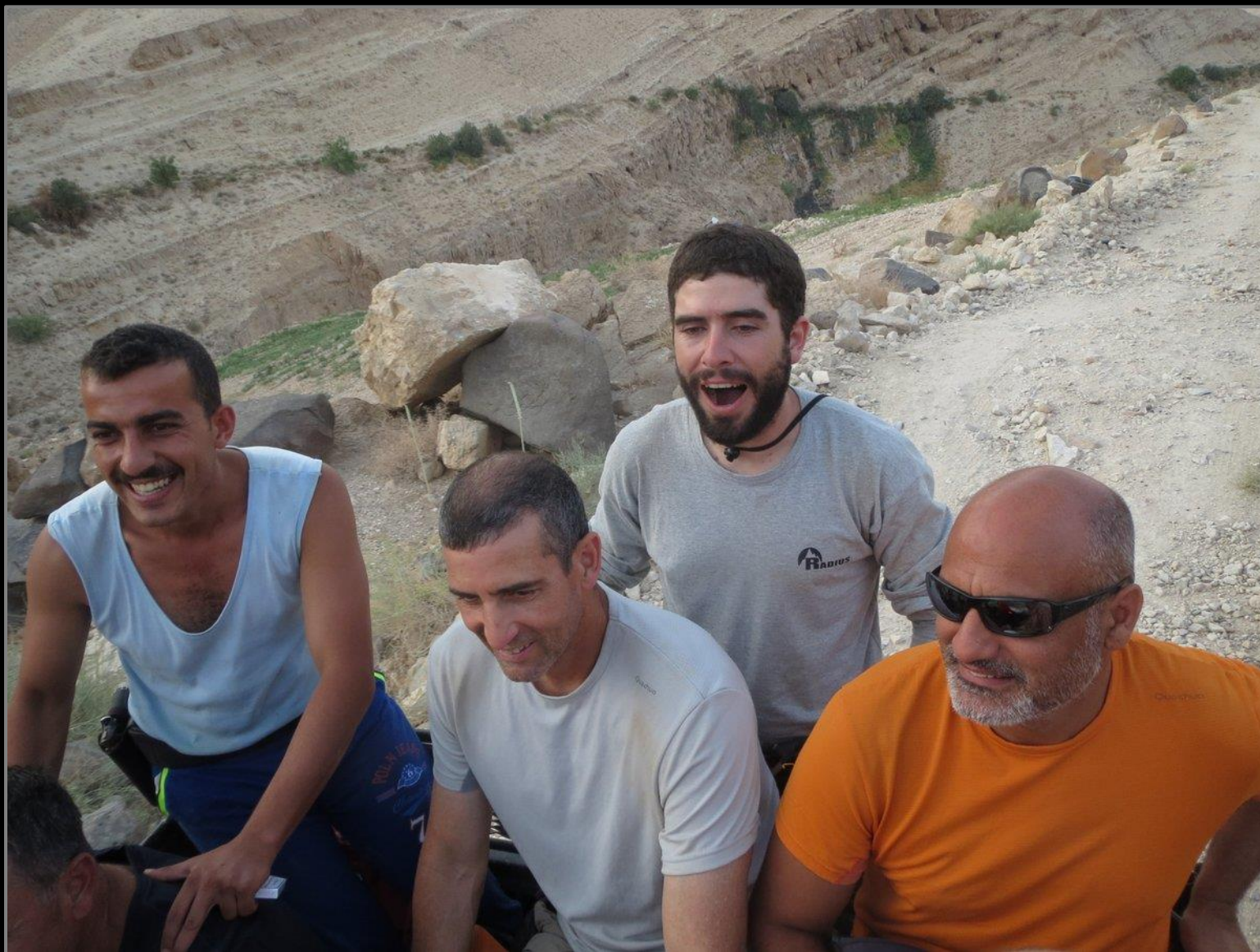
4 מתוך 16 נוסעים בטנדר פיקאפ אחד