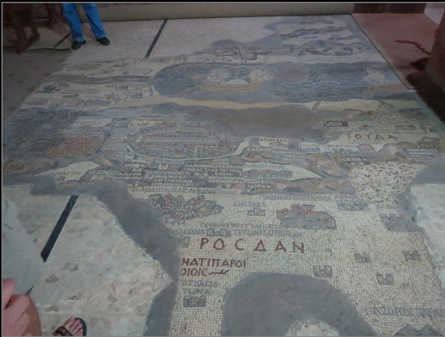
מפת פסיפס של המזרח התיכון מהמאה החמישית לספירה המפה די מדוייקת ומראה את העיר העתיקה של ירושלים בפירוט