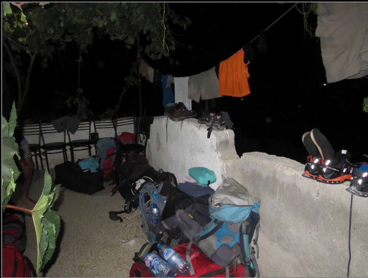
מתארחים וישנים בבית של פארס