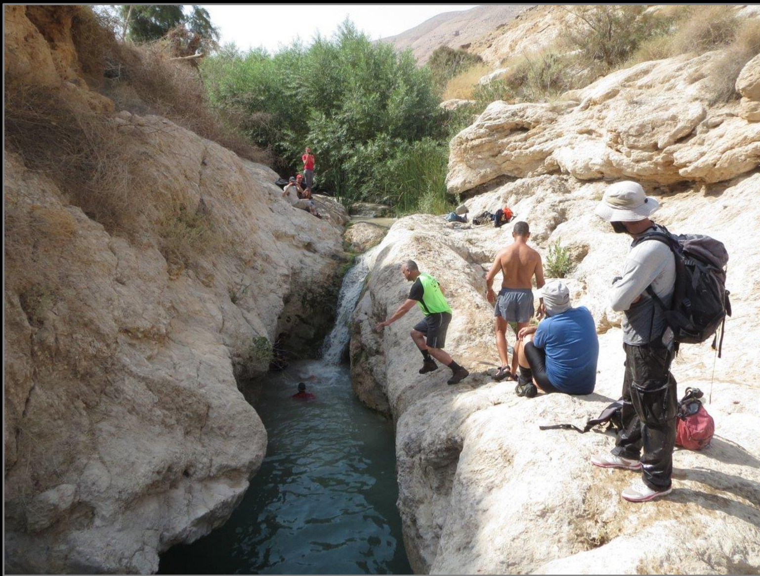
יום 3 - ואדי שקיפאת (בלוע)