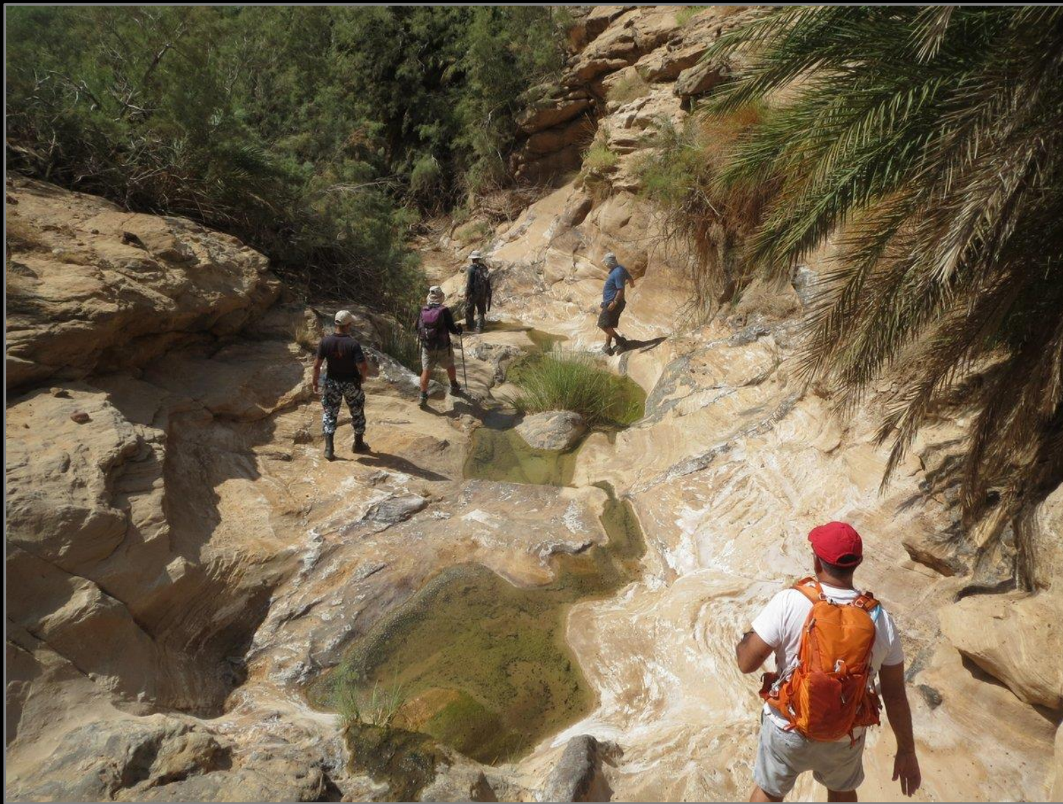
יום 1 – מעבר גבול צפוני לירדן, אבו אל עסל וחמרה