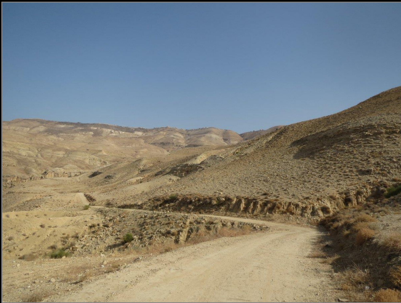
בדרך לסייד אל אחמר