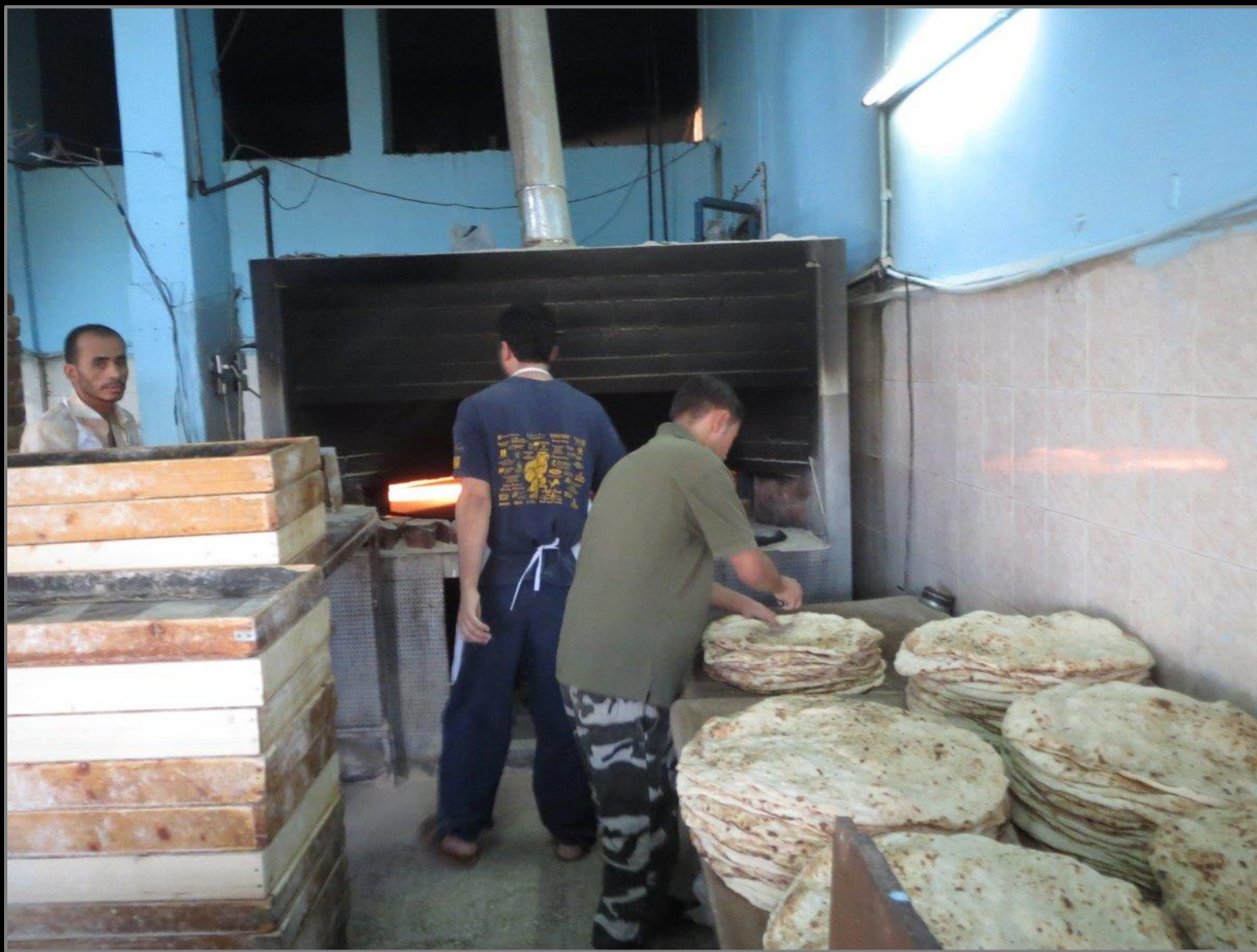
יום 2 - סיד אל אחמר ושמורת איבן חמד